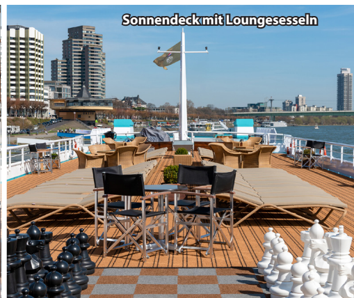
Sonnendeck mit Loungesesseln