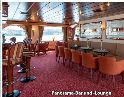
Panorama-Bar und -Lounge