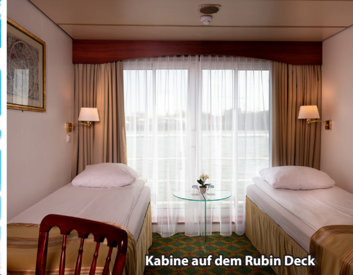
Kabine auf dem Rubin Deck