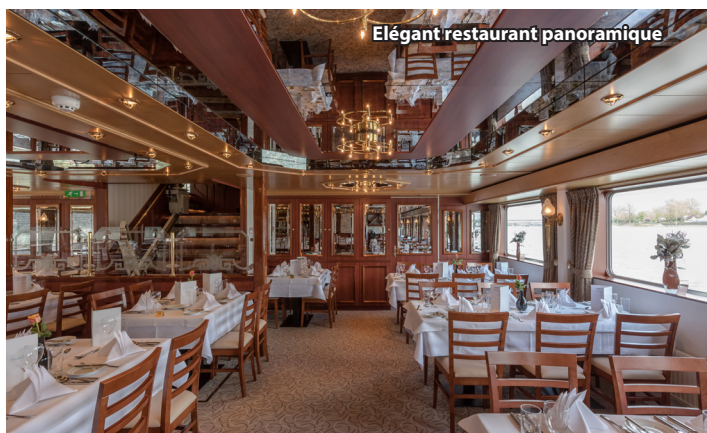
Élégant restaurant panoramique