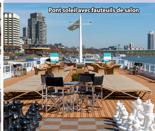
Pont soleil avec fauteuils de salon