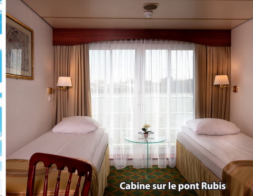
Cabine sur le pont Rubis