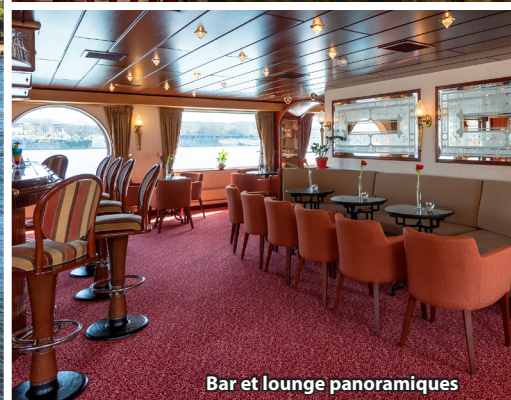
Bar et lounge panoramiques