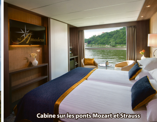
Cabine sur les ponts Mozart et Strauss