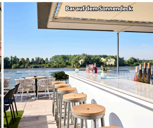
Bar auf dem Sonnendeck