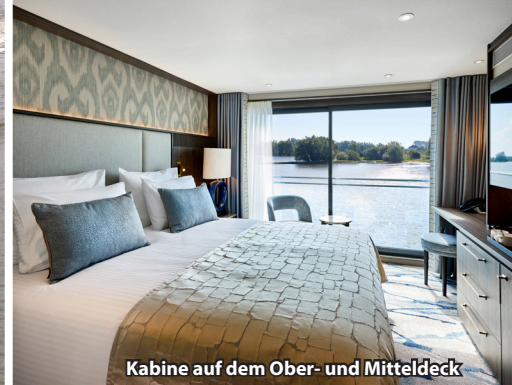
Kabine auf dem Ober- und Mitteldeck