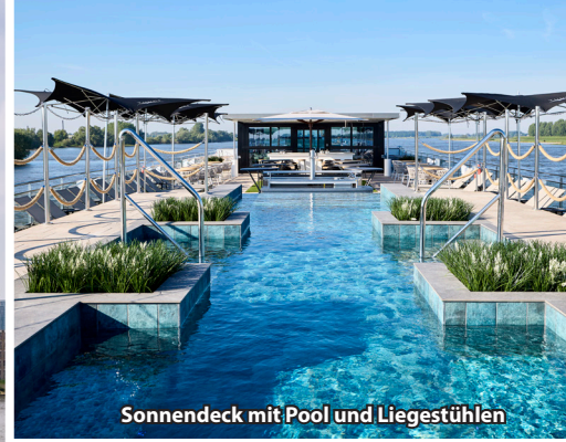
Sonnendeck mit Pool und Liegestühlen

An Bord der MS Porto Mirante (Jungfernfahrt 2024), einem speziell für den Douro entworfenen Premium-Flussschiff, geniessen Sie höchsten Komfort in besonders familiärer Atmosphäre. Das neue Schiff wurde optimal an die Gegebenheiten des Flusses und seiner Schleusen angepasst und bietet mit nur 60 Kabinen exklusives Reisen auf hohem Niveau. Freuen Sie sich auf kulinarische Höhepunkte im Panorama-Restaurant, entspannte Stunden in der Panorama- oder Sky-lounge über zwei Decks sowie auf das grosszügige Sonnendeck mit Pool – perfekt für unvergessliche Tage auf dem goldenen Douro.