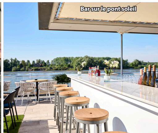
Bar sur le pont soleil