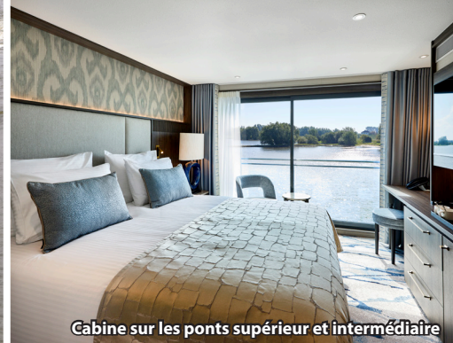
Cabine sur les ponts supérieur et intermédiaire