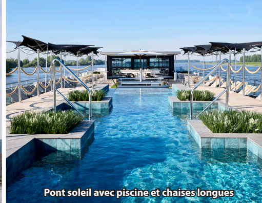
Pont soleil avec piscine et chaises longues

A bord du MS PORTO MIRANTE (voyage inaugural en 2024), un bateau fluvial haut de gamme spécialement conçu pour la navigation sur le Douro, vous profitez d'un confort optimal dans une atmosphère vraiment familiale. Ce navire de nouvelle génération est adapté aux particularités du fleuve et de ses écluses. Avec 60 cabines seulement, il offre des croisières exclusives de haut niveau. Profitez de savoureux moments culinaires au restaurant panoramique, détendez-vous au salon panoramique ou dans la vaste Skylounge sur deux niveaux et lézardez sur le grand pont soleil avec piscine – le programme parfait pour un inoubliable séjour au fil du Douro.