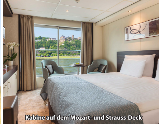
Kabine auf dem Mozart- und Strauss-Deck