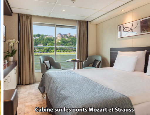
Cabine sur les ponts Mozart et Strauss