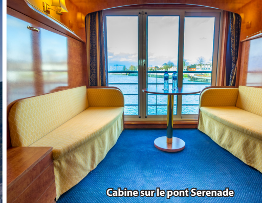
Cabine sur le pont Serenade