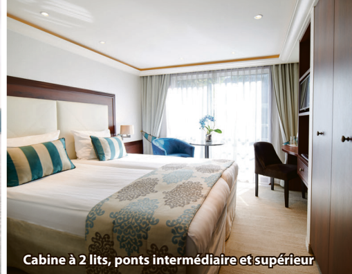
Cabine à 2 lits, ponts intermédiaire et supérieur