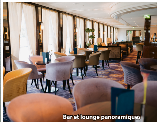
Bar et lounge panoramiques