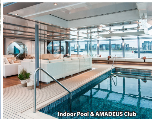
Indoor Pool & AMADEUS Club