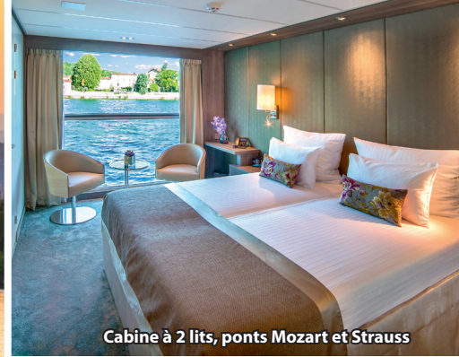
Cabine à 2 lits, ponts Mozart et Strauss