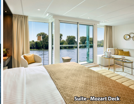
Suite - Mozart Deck