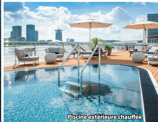
Piscine extérieure chauffée