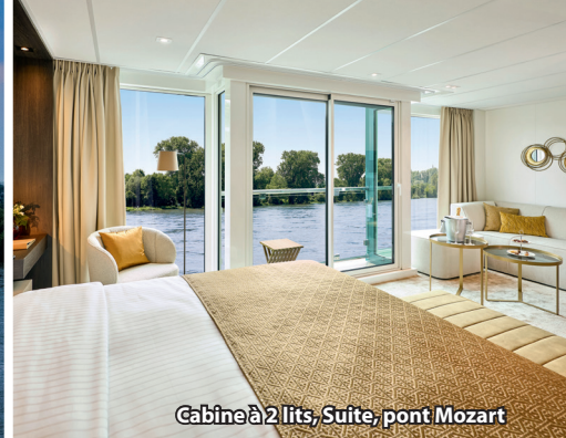
Cabine à 2 lits, Suite, pont Mozart