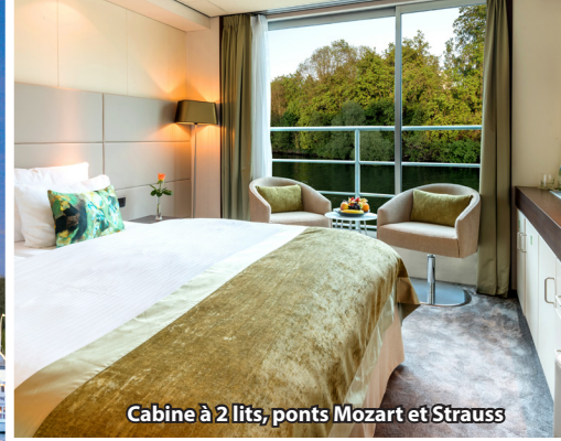
Cabine à 2 lits, ponts Mozart et Strauss