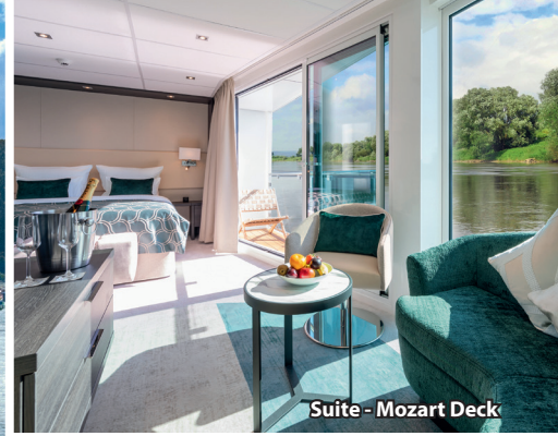
Suite - Mozart Deck