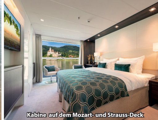
Kabine auf dem Mozart- und Strauss-Deck

An Bord der eleganten MS AMADEUS Cara (Baujahr 2022) erwartet Sie stilvoller Komfort in gewohnt hoher AMADEUS-Qualität. Grosszügige Kabinen und Suiten, viele davon mit französischem Balkon oder begehbarem Aussenbalkon, schaffen ein angenehmes Wohngefühl. Die beliebte River Terrace am Bug, das Café Vienna sowie der AMADEUS Club laden zum Entspannen ein. Als eines der neuesten Schiffe der Flotte verbindet sie modernes Design mit einer besonders wohnlichen Atmosphäre.