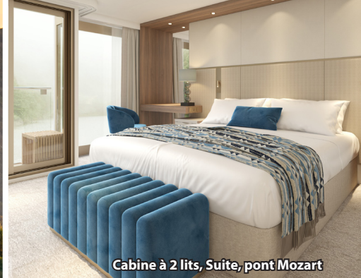
Cabine à 2 lits, Suite, pont Mozart