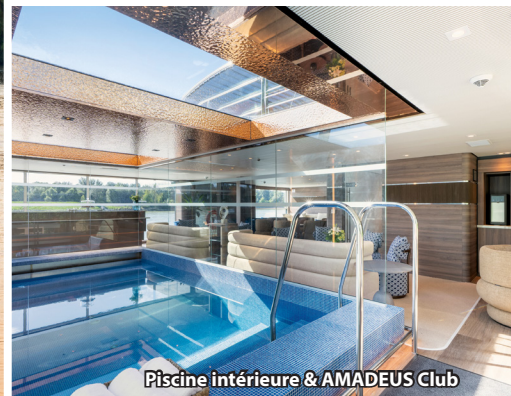
Piscine intérieure & AMADEUS Club