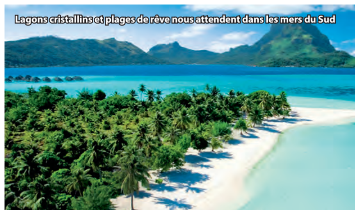
Lagons cristallins et plages de rêve nous attendent dans les mers du Sud