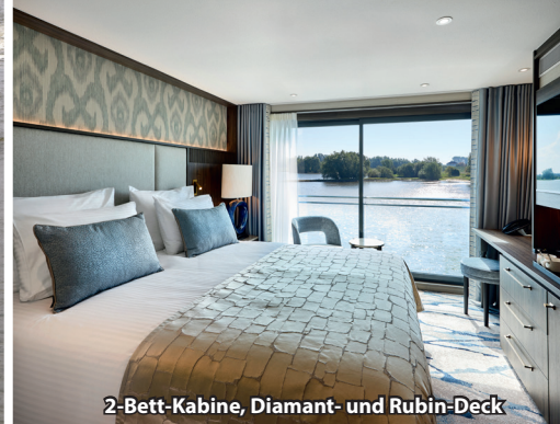
2-Bett-Kabine, Diamant- und Rubin-Deck

An Bord der PORTO MIRANTE (Jungfernfahrt 2024), einem speziell für den Douro entworfenen Premium-Flussschiff, geniessen Sie höchsten Komfort in besonders familiärer Atmosphäre. Das neue Schiff wurde optimal an die Gegebenheiten des Flusses und seiner Schleusen angepasst und bietet mit nur 60 Kabinen exklusives Reisen auf hohem Niveau. Freuen Sie sich auf kulinarische Höhepunkte in zwei Restaurants, entspannte Stunden in der Panorama- oder Skylounge über zwei Decks sowie auf das grosszügige Sonnendeck mit Pool – perfekt für unvergessliche Tage auf dem goldenen Douro.