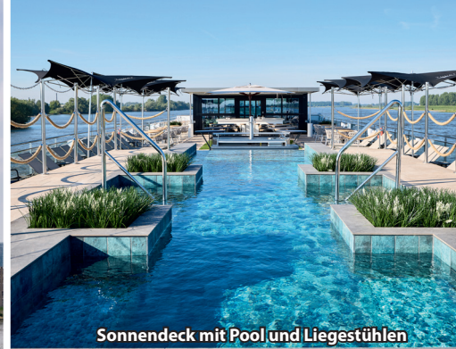
Sonnendeck mit Pool und Liegestühlen