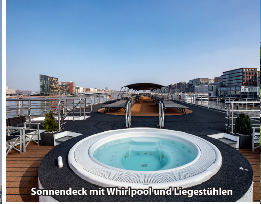
Sonnendeck mit Whirlpool und Liegestühlen