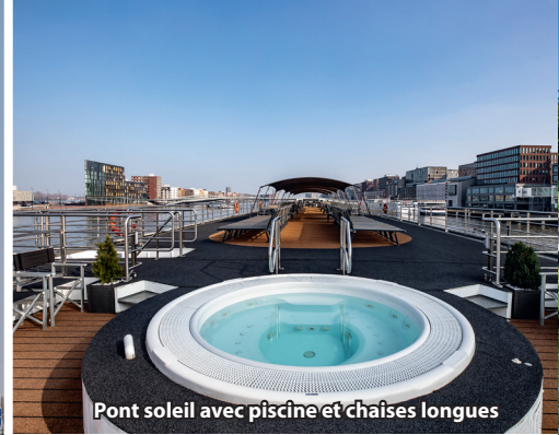
Pont soleil avec piscine et chaises longues

A bord du MS SWISS CROWN, élégant bateau de croisières fluviales de la flotte Scylla battant pavillon suisse, vous profitez de moments de bien-être raffinés dans une atmosphère classique et décontractée. Depuis sa rénovation complète en 2019, le MS SWISS CROWN affiche un style moderne et confortable – avec des cabines lumineuses, des détails soignés et un salon-lounge ouvert avec bar et piste de danse. Sur le vaste pont soleil, chaises longues et jacuzzi invitent à s'attarder. Le navire peut accueillir jusqu'à 141 passagers et se distingue par un service chaleureux et une combinaison réussie de détente, plaisir et convivialité.