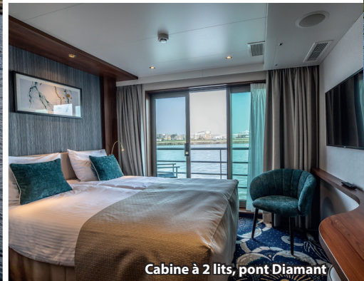
Cabine à 2 lits, pont Diamant