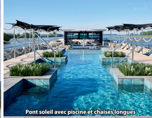
Pont soleil avec piscine et chaises longues

A bord du MS PORTO MIRANTE (voyage inaugural en 2024), un bateau fluvial haut de gamme spécialement conçu pour la navigation sur le Douro, vous profitez d'un confort optimal dans une atmosphère vraiment familiale. Ce navire de nouvelle génération est adapté aux particularités du fleuve et de ses écluses. Avec 60 cabines seulement, il offre des croisières exclusives de haut niveau. Profitez de savoureux moments culinaires dans deux restaurants, détendez-vous au salon panoramique ou dans la vaste Skylounge sur deux niveaux et lézardez sur le grand pont soleil avec piscine – le programme parfait pour un inoubliable séjour au fil du Douro.