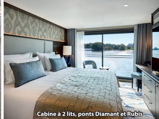
Cabine à 2 lits, ponts Diamant et Rubis