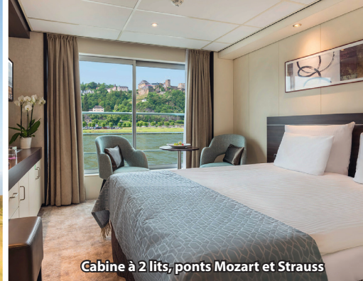
Cabine à 2 lits, ponts Mozart et Strauss