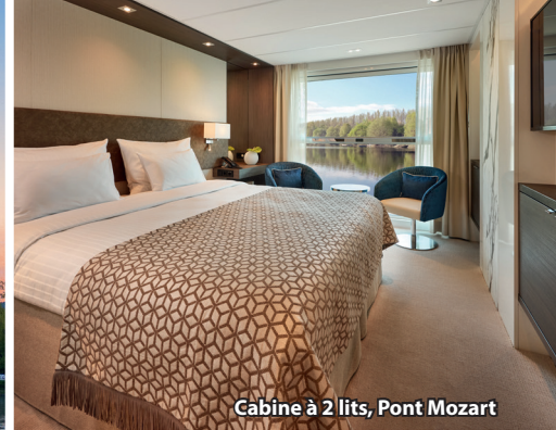
Cabine à 2 lits, Pont Mozart