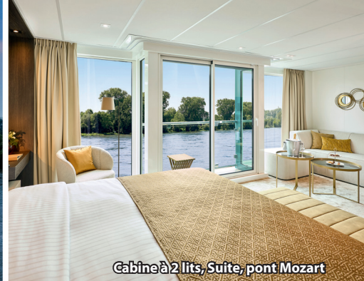
Cabine à 2 lits, Suite, pont Mozart