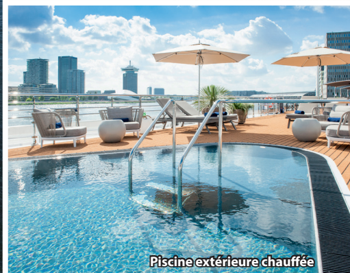
Piscine extérieure chauffée